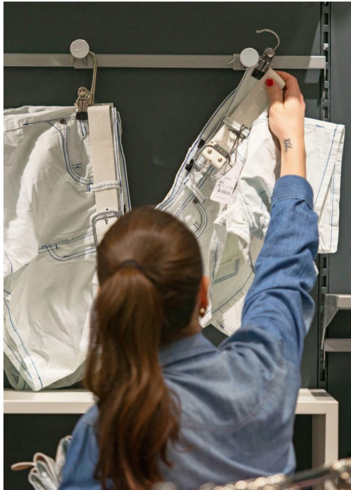
Im Detailhandel wird oft Teilzeit verlangt.

Eine aktuelle nationale Auswertung des Bundesamts für Statistik stützt diese Aussage: In