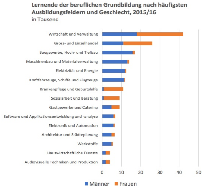
Abbildung 1: Berufliche Grundbildung nach Ausbildungsfelder und Geschlecht 2015/2016 (eigene Darstellung nach BFS 2017)

Auch die Fachstelle für Gleichstellung von Frau und Mann des Kantons Zürich (2013: 3) hat in ihren Untersuchungen festgestellt, dass junge Männer und Frauen ihren Beruf nach bestimmten Mustern aussuchen. Sie teilen die Berufe nicht wie das BFS (2017) in Gruppen ein, sondern schlüsseln jeden Beruf einzeln auf. Dabei ist die Geschlechtersegregation noch deutlicher erkennbar. So sind von den 25 unten aufgeführten Berufen in sechs Berufen mehr als 30% Frauen tätig und 12 Berufe werden von mehr als 30% Männern ausgeführt: