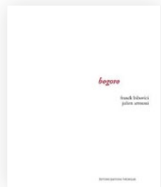
bogoro