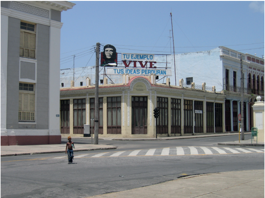
Cienfuegos/Kuba, 2009

Mit dem Studium in «Geschichte, Geografie, Politische Bildung» erwerben Sie die Lehrberechtigung für das Schulfach «Räume, Zeiten, Gesellschaften» (RZG) gemäss Lehrplan 21. In Kantonen, die dieses Integrationsfach nicht führen, gilt die Lehrberechtigung für die Fächer Geschichte und Geografie.